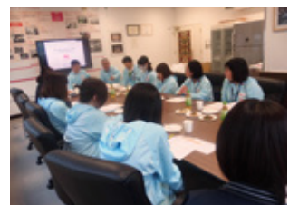
お客様からいただいた情報を商品開発・改善につなげる。