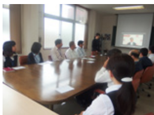
お客様の生の声を聴き、共有する。